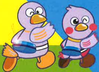
埼玉県のマスコット「コバトン」と「まいたまっさ」