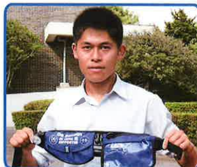
スペシャルサポーター 川内 優輝さん