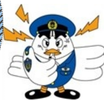
埼玉県警マスコット 「ポッポくん」