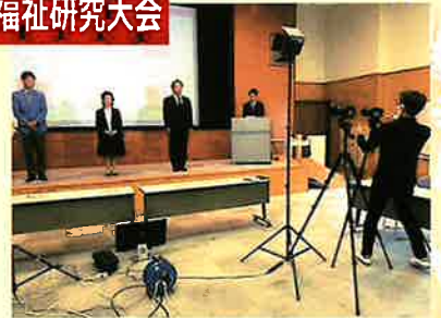
オンライン開催（録画撮り）