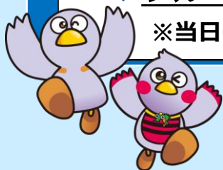
埼玉県マスコット「コバトン」「さいたまっち」

※リアルタイム開催のため、昨年度から変更している点がありますのでご注意ください。