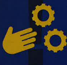
安全な職場づくり部門