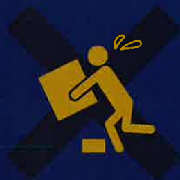
転倒災害防止部門