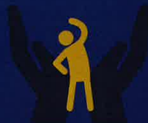
エイジフレンドリー部門

労働災害防止に向けた取組を実施している企業・団体に取組内容を応募いただき、優れた取組を部門別に表彰いたします。