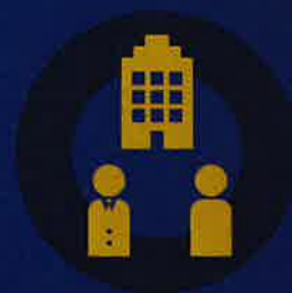
企業等間連携部門